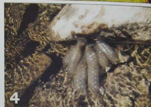
Рис. 1. Семиреченский лягушкозуб обычной окраски (фото О.В. Белялова) Рис. 2. Семиреченский лягушкозуб-меланист (фото О.В. Белялова) Рис. 3. Долина р. Борохудзир (фото О.В. Белялова) Рис. 4. Кладки лягушкозуба (фото Р.А. Кубыкина) Рис. 5. Личинка первого года (фото О.В. Белялова)