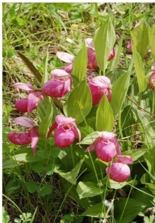
Куртина (много стеблей одной особи)