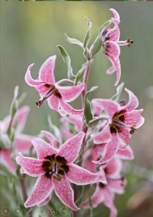
Соцветие (много цветков на цветоносе)