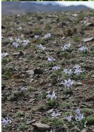
Ценопопуляция (много растений в ландшафте)