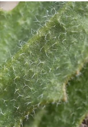
Шипики и волоски (снять макро)